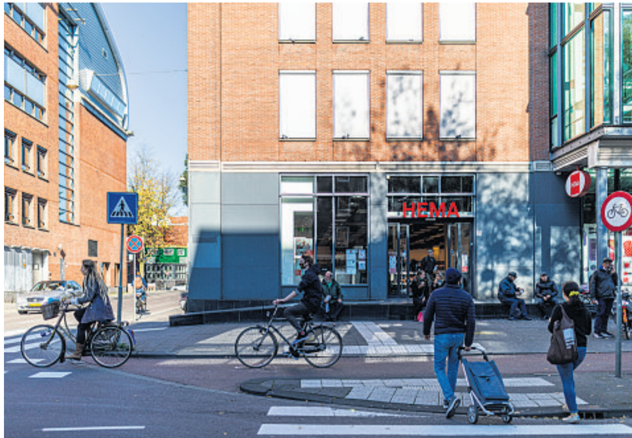
De vraag om overheids garantie op de leningen maakt van Hema een politiek dossier.

Parcom en Van Eerd vinden dat Hema ook na de schuldsanering te veel geld kwijt is aan rente. De winkelketen betaalt jaarlijks €28 mln aan rente, meer dan een kwart van de brutowinst. Om dat bedrag omlaag te krijgen, willen Parcom en Van Eerd de huidige schulden van Hema aflossen. Daarvoor willen zij €300 mln lenen bij ABN Amro, ING en Rabobank. Zelf legt het consortium €150 mln in. Daarnaast probeert het een doorlopende kredietfaciliteit van €100 mln voor schommelingen in het werkkapitaal los te weken bij de grootbanken. De bankleningen kennen naar verwachting een rentepercentage van rond de 4. Dat is een stuk minder dan Hema nu betaalt: het grootste deel van deze leningen kent een rentevergoeding van 7,5%.